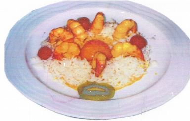
COLAS DE GAMBAS Riesencrevettenschwänze mit Curry-Reis