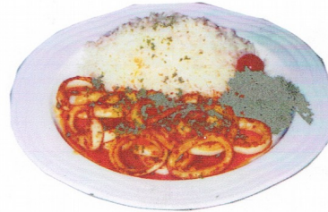
CALAMARES „A LA PLANCHA“ Grillierter Tintenfisch mit Reis und Knoblauch