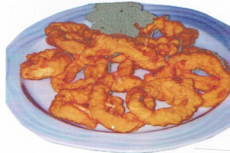
CALAMARES „A LA ROMANA“ Frittierte Tintenfischringe