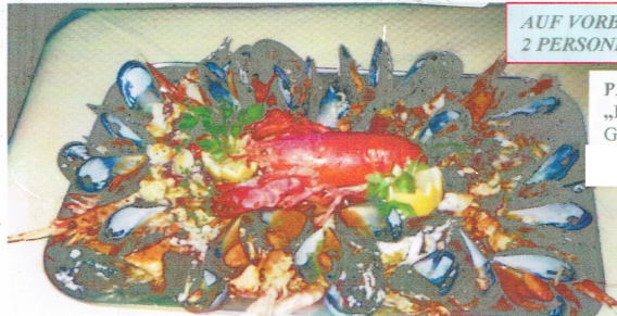
PARRILADA DE PE „FISCHPLATTE“ Gemischte grillierte Meeresfrüchte